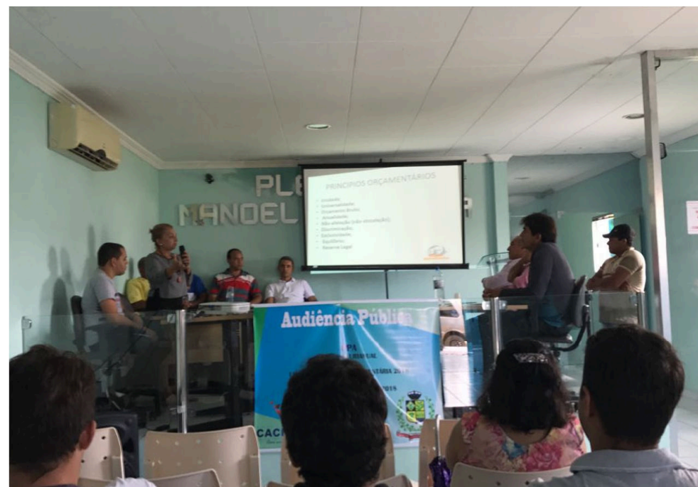
3) Comprovante de Realização de Audiência Pública. Doc. 82391/17. Data: 13/12/2017 09:13. Responsável: Rogério L. E. Alves. Impresso por convidado em 09/08/2024 10:37. Validação: 4D7A.CA1B.D67A.F4B2.753D.18B6.02F9.614E.