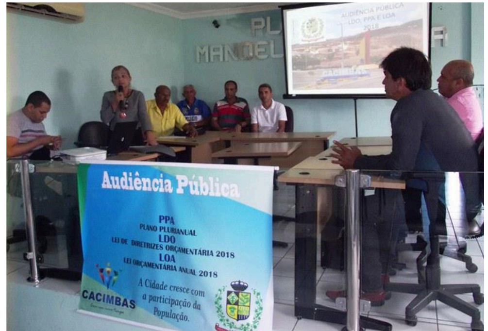
3) Comprovante de Realização de Audiência Pública. Doc. 82391/17. Data: 13/12/2017 09:13. Responsável: Rogério L. E. Alves. Impresso por convidado em 09/08/2024 10:37. Validação: 4D7A.CA1B.D67A.F4B2.753D.18B6.02F9.614E.