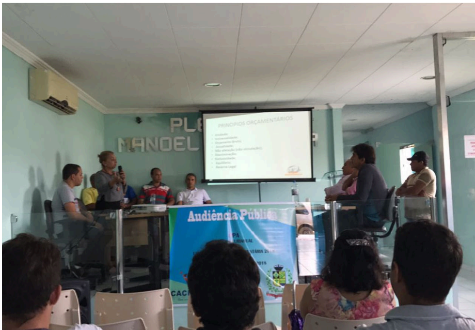
3) Comprovante de Realização de Audiência Pública. Doc. 82391/17. Data: 13/12/2017 09:13. Responsável: Rogério L. E. Alves. Impresso por convidado em 09/08/2024 10:37. Validação: 4D7A.CA1B.D67A.F4B2.753D.18B6.02F9.614E.